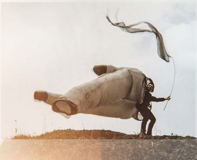
Judith Egger: Transmission Wind, video still, 2020 © Judith Egger

Videokunst im Rahmen der Traunsteiner Sommerkonzerte Besichtigung nur im Rahmen eines Konzertbesuchs und auf Anfrage. In Kooperation mit den Traunsteiner Sommerkonzerten und dem Kunstverein Traunstein e.V. Foyer Kulturforum Klosterkirche