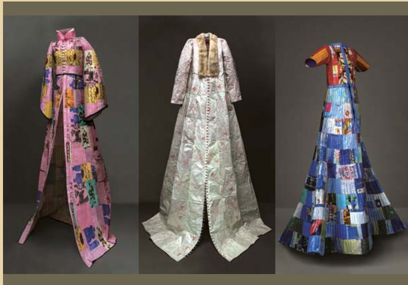
Patricia Thoma: Marokkanisches Müllkleid, 2012, 190 cm, marokk. Plastikverpackungen. Foto: B. Massah Brautkleid II, 2013, 220 cm, Mülltüten, Nerz, Garn, Perlen. Foto: B. Massah Japanisches Müllkleid II, 2008, 170 cm, Japanische Plastikverpackungen und Tüten, Garn. Foto: B. Massah