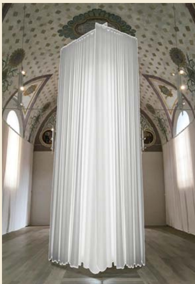
Martin Schmidt: Visualisierung „Mysterium“, © Martin Schmidt Heiko Börner: ohne Titel, Buche, Faden 17/03

Installationen von Martin Schmidt und Heiko Börner Klosterkirche